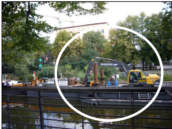
Sondierungsarbeiten an der Teststrecke