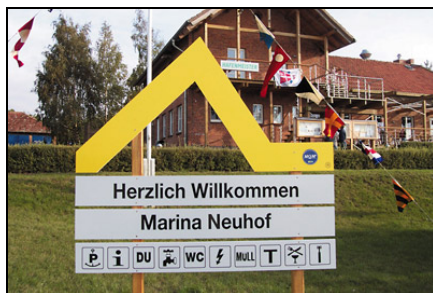
Beispielschild der „Gelben Welle“