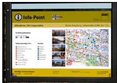
Beispielschild des ADAC, InfoPoint, Quelle: SenWTF

Herzlichen Dank für die Zuarbeit durch SenWTF.