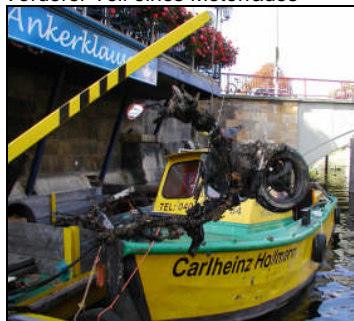
Vorderer Teil eines Motorrads